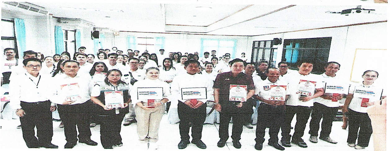
ภาพถ่ายกิจกรรมการประกาศเจตนารมณ์ “สุจริต โปร่งใส องค์การบริหารส่วนตำบลเจนีงไสสะอาด ๒๕๖๙” และ “งดรับดให้” ของขวัญของกำนันทุกชนิดจากการปฏิบัติหน้าที่ (No Gift Policy)