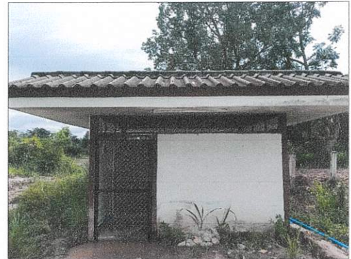
4. โครงการก่อสร้างวางท่อระบายน้ำภายในตำบลเจนีง หมู่ที่ 7 บ้านห้วยราช ต.เจนีง อ.เมืองสุรินทร์ จ.สุรินทร์สอดคล้องกับยุทธศาสตร์ด้านโครงสร้างพื้นฐาน